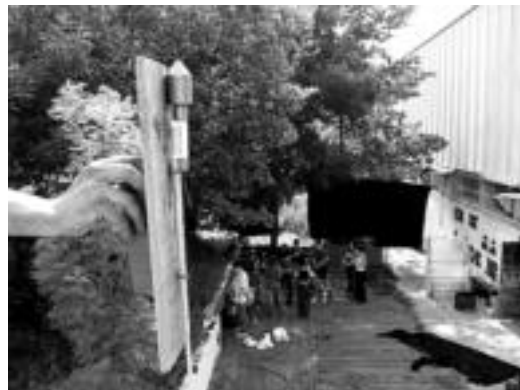
Atzo arratsaldean txupinazoa botaz hasi ziren ekitaldiak. D. GIBELALDE

Gazte Asanbladako kideek 'Pusketaka' antzezlanaren eskainiko dute; ondoren, Nekin eta Izeba Pilarren ilobak