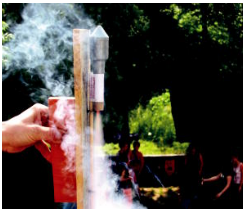
Gaztetxearen urtemugako ekitaldiei hasiera emateko txupinazoa bota zuten atzo arratsaldean. DANI GIBELALDE

KULTURA ▶ Afaria, antzerkia eta Nekin eta Izeba Pilarren ilobak taldeen kontzertua izango dira gaur ▶ 5