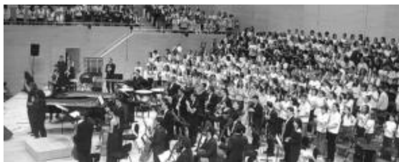
Laskorain ikastolako abesbatzakoek kontzertua eskaini zuten Vilafranca del Penedeseko auditorioan. HITZA

Vilafranca del Penedes herriko L'Espinguet abesbatzakoekin aritu dira kantuan; bertako kideen etxeetan hartu dute ostatu