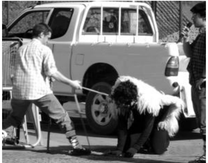
Hernaniko Iraulio Panttalone antzerki eskolakoek saioko une bat, joan den igandean.

Beste herri askotan arrakastatsua izan zuten bertso eskolakoek ikuskizunak, eta ez zen gutxiago gertatu Elduainen. Gogotik gozatu zuten herritarrek.