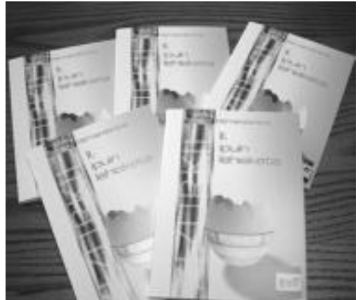
Ipuin lehiaketako liburuxkak aurkeztu zituzten. TOLOSALDEKO HITZA