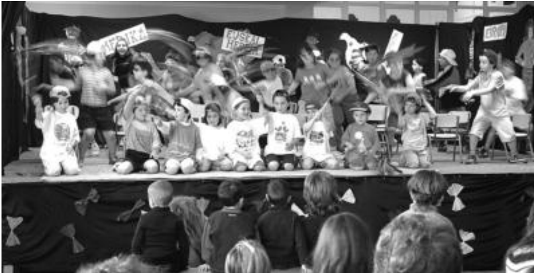
Berrobiko eskolako maila guztietako haurrek abestiak, dantzak, eta antzerkia eskaini zituzten. Jendez gainezka izan zen Etxola.