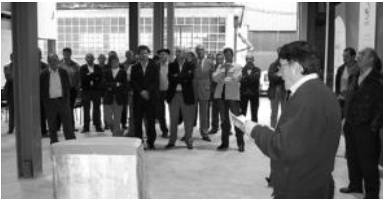
Goian, hainbat erakundetako ordezkariak, Gipuzkoako Baso Elkartearen egoitza berriaren inaugurazioan. Behean, apaizak egoitza bedekatu zuen unea, ordezkariak eta baso-jabeak atzean direla. LEIRE MONTES

FERNANDO OTAZUA ▶ GIPUZKOAKO BASO ELKARTEAREN GERENTEA