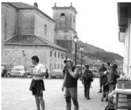
Herriko plazatik abiatuko da datorren igandeko, maiatzaren 30eko, ibilaldia. Argazkian, Erniopeko marbxako partehartzaileak ikus daitezke Albizturko plazan jarri zuten janari postuan.

Kultur Asteari amaiera emateko herriko mugetatik zehar ibilaldia antolatu dute. Hori datorren igandean, maiatzaren 30ean, izango da. Ibilaldia, Benta Berritik Santutxora izango da; herriko plazatik abiatuko dira. Ondoren, hamaiketako izango da ibilaldian parte hartzen dutenentzat.