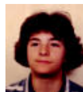
URTE ASKOAN Kaskoa buruan eta ibili munduan. Zorionak Tube.