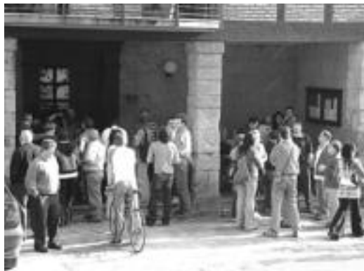
Larunbatean egin zen txakoli eta sagardo dastaketako une bat. HITZA