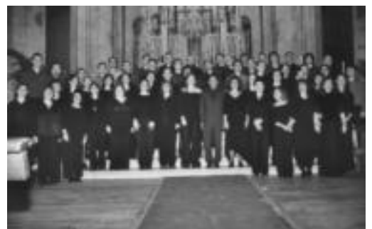
Kanta Cantemus koruaren kontzertua larunbatean izango da. HITZA