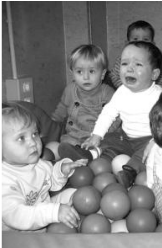
0 eta 3 urte bitarteko haurerentzat izango dira haru-eskolak. LEIRE MONTES

Izena eman nahi duten gurasoek lehen aipatu herrietako udaletxera joatea besterik ez dute, bertan emango zaizkie bete behar dituzten baldintzen berri, eta eskaera egiteko inprimakiak. Informazio gehiago nahi duenak ere berdin egin