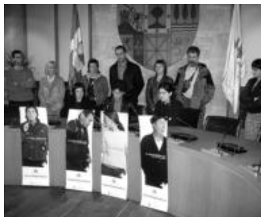
Bai Euskarari taldeko kideak, prentsaurrean. JOXEMI SAIZAR

Hirugarren neurriak konpromisoa eskatzen du. Herritarrei ere hizkuntz eskubideekiko konpromisoa eskatuko die Kontseiluak herriz herri. Konpromisoak publikoak izango dira, eta gero jarripena egingo zaie, konpromiso horiek betetzeko garaian izaniko zailtasunak aztertu eta gainditze bidean jartzeko. Printzipioz, zerbait masiboa egin ordez, pertsona erreferentzialen konpromisoak lortu nahi dituztela azaldu zuten prentsaurrean bildu ziren Kontseiluko kideek.