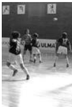
Hegoaldeko neskek. HITZA

Gol aukera ugari izan zituzten lehenengo bost minutuetan; eta «partida erraz irabazteko aukera ikusita asko moteldu zuten joko tolosarrak».