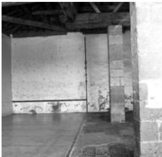
Zimiteyuan izango dira partidak. G. AZKUE

Izena emateko Iriarte tabernara jo beharko da, edo besteala, 649 31 70 61 edo 943 69 20