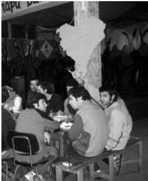
Gaztetxeko afarietan jende ugari bildu ohi da. HITZA

4 itzal, Sufin Kaos, Nekin eta Txirrikas taldeek joko dute; eta tortila, mus eta pilota txapelketak izango dira asteen