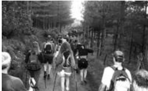
biltariak, igandean, Uli inguruan.

Antolakuntzaren izenean, batik bat anoa guneetan eta kontroletan, 250 bat boluntario aritu dira lanean. Gurutze Gorriko, Euskal Mendi Federazioko eta Nafarroako Polizia Foraleko kideak kontuan hartuta, 400 lagunek egin dute lan.