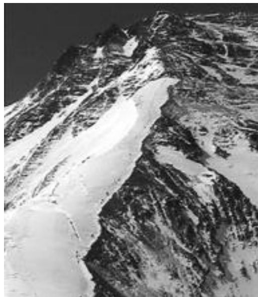
Everestera, munduko mendirik garaienera igo da gazteluarra. HITZA