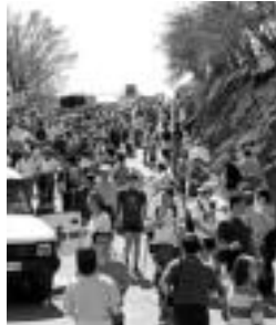
Jendetza San Migelen; Gurutze Gorrikoak, lanean. L.MONTES/O.ESKITXABEL