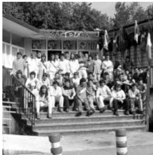
Pijamak soinean zituztela agertu ziren gazteak. G. AZKUE

Villabonara iritsi eta parodia egiteko jantzi zituzten guztiak pijamak, dotore. Trikipoteoa eta afaria izan ziren ondoren, 110 lagunek eman zuten izena Gazte Asanbladak antolatutako bertso afarian. Festa giroa. Kontzertuek ere ez zuten huts egin, eta Gaztetxean bertan jarraitu zuen festak. Oso ongi pasa zutela azaldu zuten bertaratu ziren gazteek.