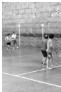
Finaleko partida bat. G. AZKUE

Irabazleek, kopak eta txapelak etxeratu zituzten eta parte hartzaile guztien artean, sariak