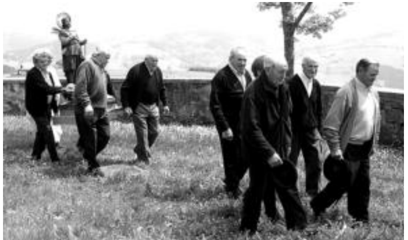
Abaltzisketa. Ohi bezala elizari buelta eman zioten San Isidoren irudia besoetan eramanez. O.ESKITXABEL