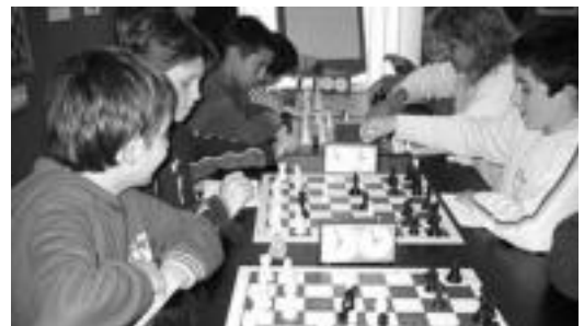
Eskualdeko herrietatik inguratu ziren partehartzaileak.