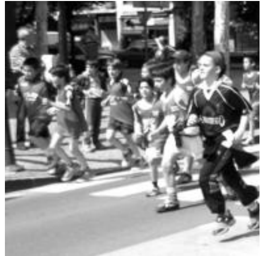
San Frantzisko kalea zeharkatu eta Berazubira iritsi ziren. O.ESKIXABEL

Larunbatean, maiatzaren 22an, Olinpiadetako azken probak egingo dituzte. Orduan ja- kingo da behin betiko sailka- penak; proba bakoitzak sailka- pen propioa izango du.