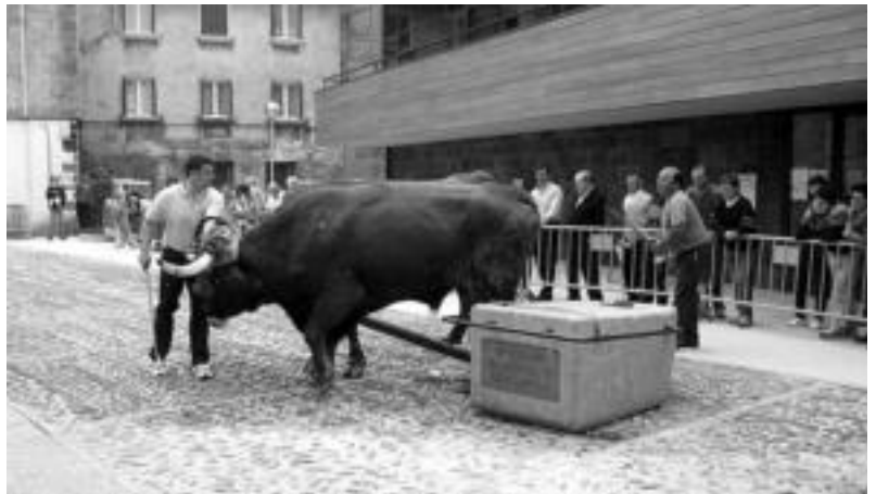
Asteasu. Idi-proban Olarreagagoikoa eta Barriola aritu ziren idiekin Asteasuko plazan. G. AZKUE

Elduainen, gaur izango dira San Isidro eguneko ekitaldiak; gazta lehiaketa, bazkaria, bertsolariak eta kale antzerkia egingo dituzte, besteak beste, baserritarren egunaren aitzakipean.