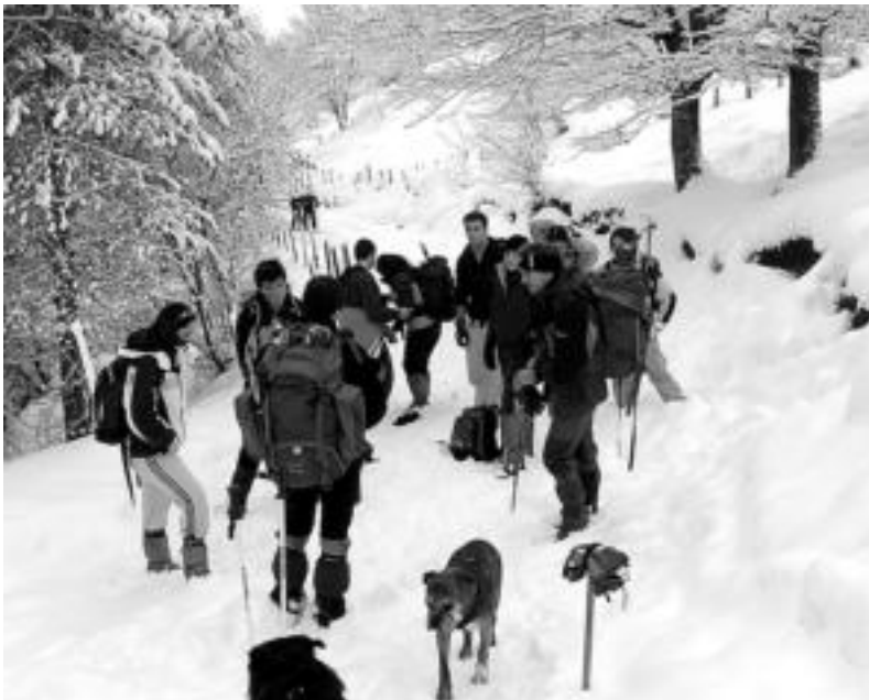
Irteera ugari egiten dituzte ikasleek ikastetxetik kanpora, mendira, bizikletaz eta zaldiz. HITZA

Mendia, bizikleta eta zaldiaren inguruko jardueretan gidaria izateko ezagupen teoriko eta praktikoa enpresaren munduarekin konbinatzen ditu ziklo honek