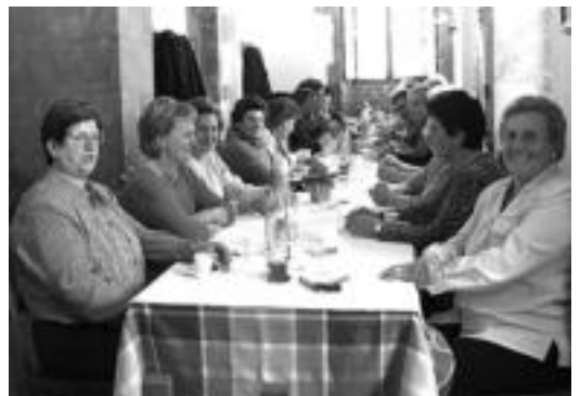
Orendain. Ostatu jatebean bazkaldu zuten orendainarrak meza entzun ondoren; 40 lagun inguru bildu ziren bertan. O.ESKITXABEL