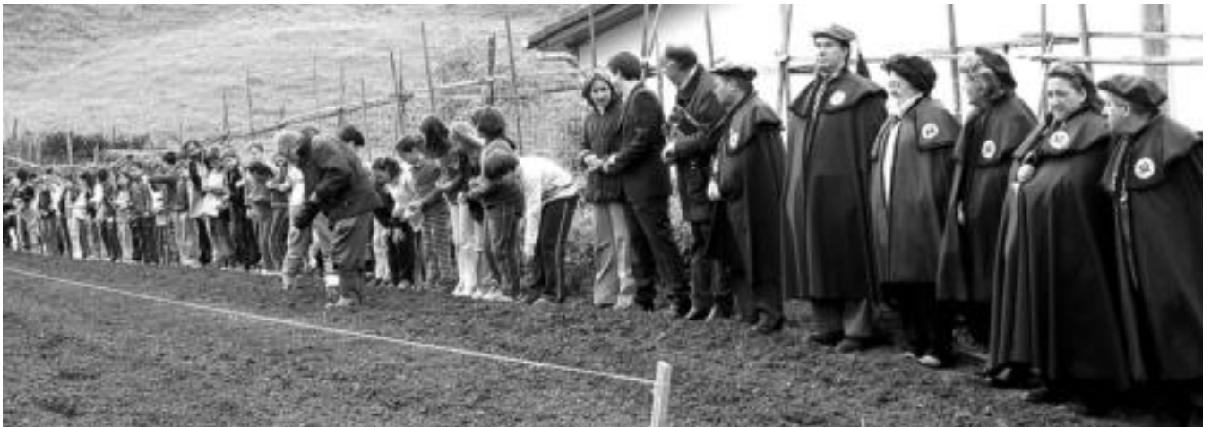
Udal ordezkariak, Tolosako Babarrunaren Ekoizleen elkarteak, Tolosako Babarrunaren Kofradiako kideak eta Samaniegoko ikasleak, Arzakekin, atzo, babarruna ereiten. I. ETXEBESTE