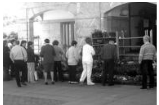
lazio Larraulgo lore azoka. U. URREGA

10:30etik eguerdira arte egongo da lore azoka; maiatzaren 23an ere egingo dute