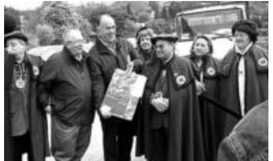
Goian: Arzak, udal ordezkariak eta Tolosako Babarrunaren Ekoizleen elkarteak; behean, Tolosako Babarrunaren Kofradiakoak. I. ETXEBESTE