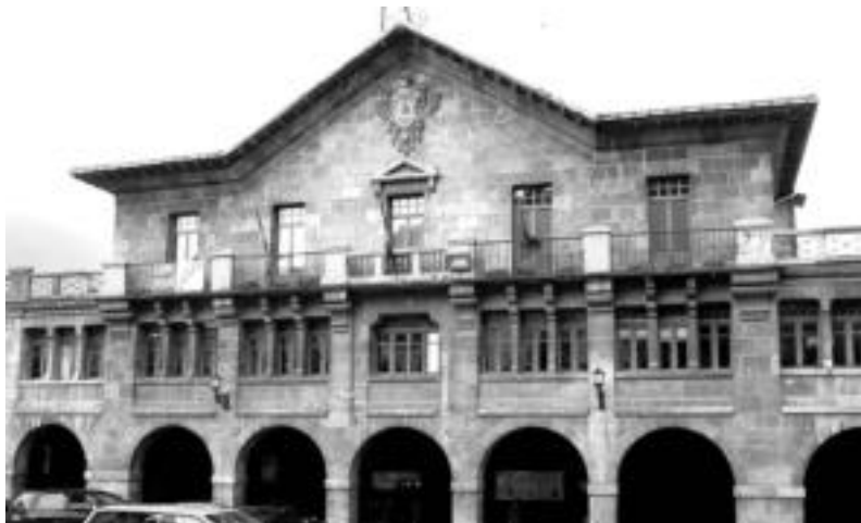
Leitza eta Aresoko berriak jasoko ditu egunero HITZAK. Argazkian, Leitzako udaletxea.

Duela hilabete batzuk hasitako lanaren emaitza da ekimen berria. Historikoki Gipuzkoako eta Nafarroako bi eskualde horiek beraien artean izan duten harremana zela-eta sortu zen zabalpenaren ideia HITZAKO arduradunen artean.