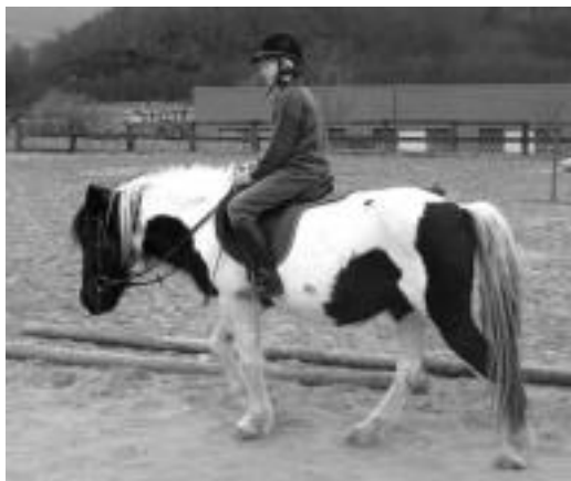
Zaldiaren inguruan ekintza ugari prestatu dituzte. TOLOSALDEKO HITZA

Askotariko heziketa erakustaldiak, gurpil eta barrika probak, zaldi erakustaldia harriekin, arraza ezberdinen erakusketa edota ferratze eta burdinlanen erakusketa ikusteko aukera izango da, besteak beste bihar.