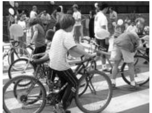
laz bezala hainbat kirol proba izango dira aurten ere. ALOÑA IPINTZA

Nesken arteko pala partidarekin hasiko dituzte astebeteko ekitaldiak