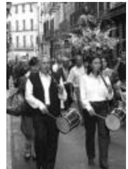
lazko prozesioaren irudia.

Maria elizako atarian bilduko dira ondoren herriko kaleetan zehar prozesioa egiteko. Meza. 12:00etan Santa Maria elizan.