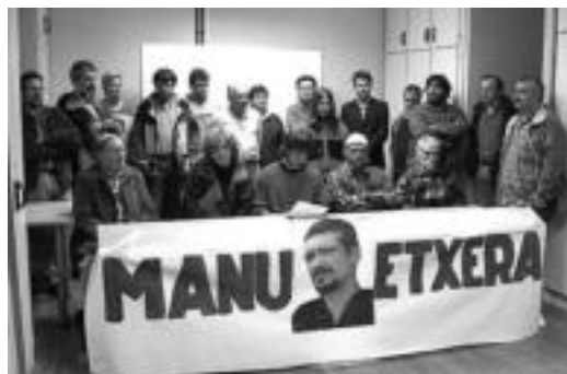
Gizarte eta politika eragile ugari bildu zen atzo. JOXEMI SAIZAR

Azkarateri ezarritako hirugarren gradua eta bete beha-