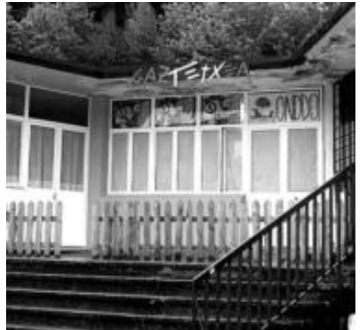
Villabonako Gaztetxea, Flemingo eraikinean. G. AZKUE