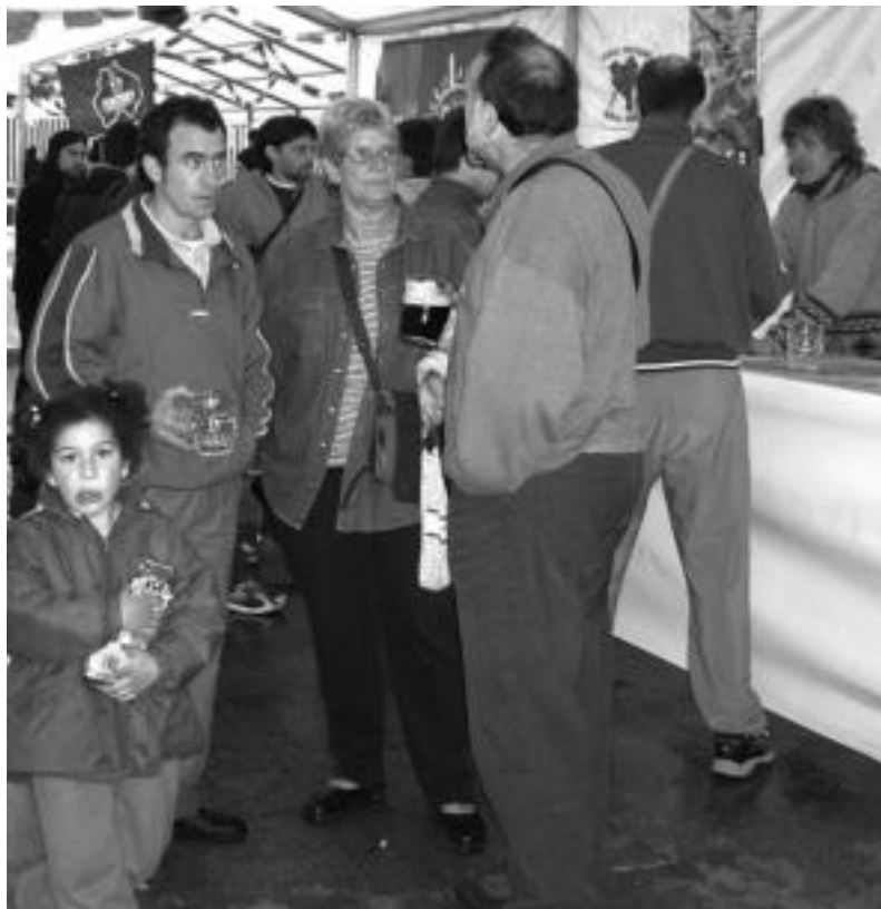
Zabaldu bezain laster hurbildu zen jendea Garagardo Festara. D. GIBELALDE

Olinpiada Txikietan, Kaxubi taldeak ere parte hartu zuela ez genuen aipatu atzoko albistean.