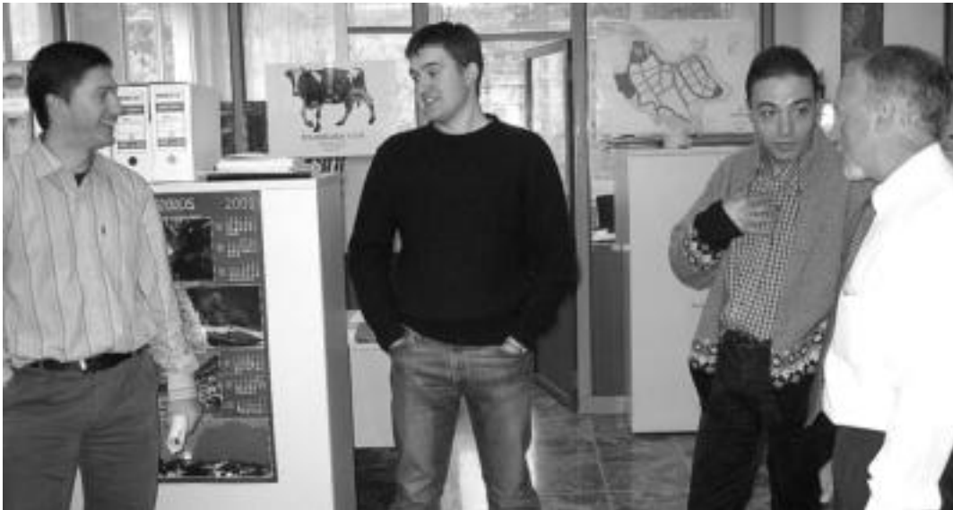
Tolosaldea Garatzen-eko arduradunak, elkartearen egoitzan, herenegun, Mendi 4WD enpresako arduradunekin hizketan.

2003an 34 proiektu aztertu zituen Tolosaldea Garatzen-ek eta 26 dira jada abian