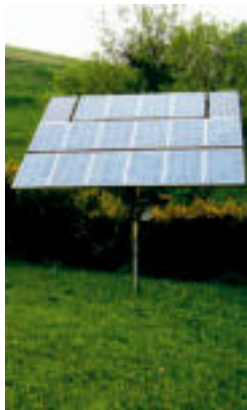
Eguzki plakak. O.ESKITXABEL