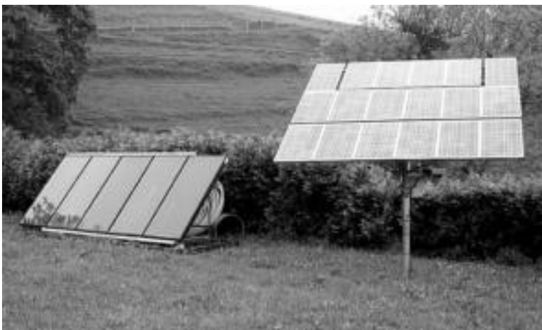
Argia eta ur beroa lortzeko plakak dira honakoak; eguzkiaren indarra jasotzen dute. O. ESKITXABEL

Argia, ur beroa... eguzkiaren indarrak, lurraren edota egurraren berotasunaz lortzeko bideak eskaintzen dituzte energia berriztagarriak