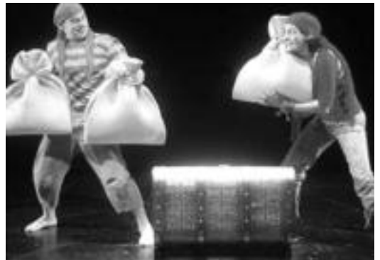
Igandoetan piratek jai antzezlaneko une bat. TOLOSALDEKO HITZA

Bestalde, haurra emozioen mundura hurbildu nahi dute eta, bide batez, inguruko hel-