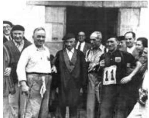
Lehen aldietako partaideak.