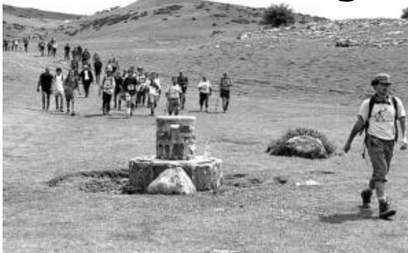
2000ko XIV Orduko Ibilaldiko parte-hartzaile batzuk, Aralarko bide seinalearen inguruan. TOLOSALDEKO HITZA