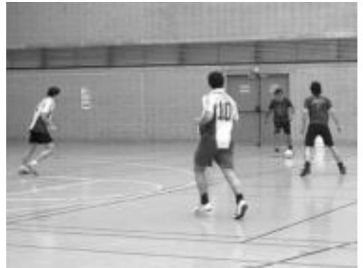
Danon Txokoa eta Bibalabirjen larunbateko partidak. G. AZKUE