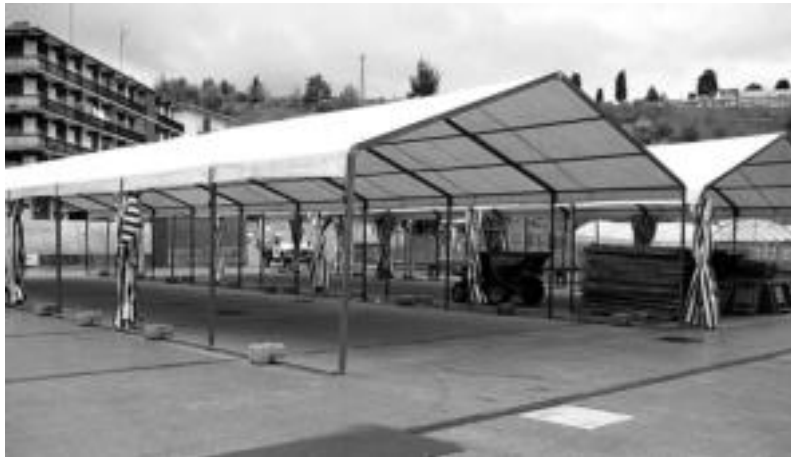
Udaletxearen parean bi karpa jarri dituzte dagoeneko, 500 laguntzako tokiarekin. D. GIBELALDE

Bihar hasita, igandea bitarte egingo da I. Garagardo Festa herrian; ordurako dena prest izateko elkarlanean ari dira hainbat talde