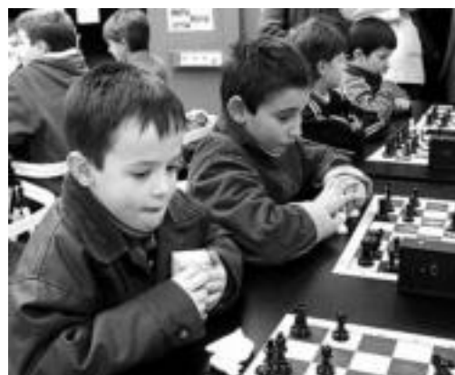
Txikiak ere bikain aritzen dira xakean. TOLOSA-IHARRA XAKE ELKARTEA