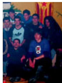
Gaztebeko kideak. G.AZKUE

Mendi irteera, bazkaria, jokoak, afaria eta kontzertuak izango dira 15ean ▶ 4