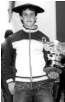
Txapela eta kopa erakusten. HITZA

Ordu eta laurdenero iraupea izan zuen partidak: «Iraupeak partidaren gogortasuna