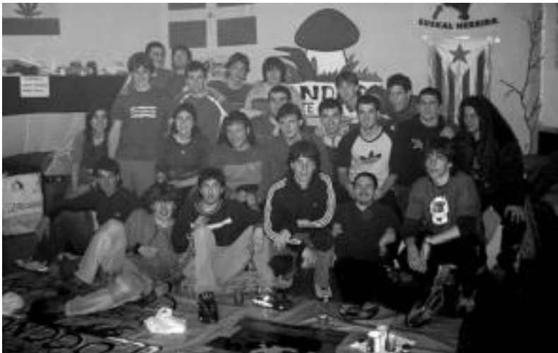
Gazte ugai biltzen da egunero Villabonako Gaztetxean. G. AZKUE

Larunbatean izango da festa Villabonan; mendi irteera, bazkaria, jokoak, afaria eta kontzertuak izango dira