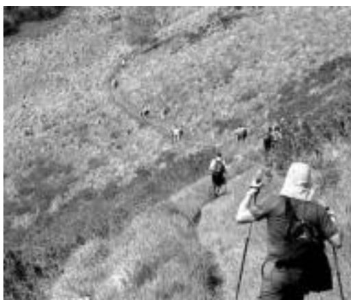
Zeltungo bidean eguzkiak gozatzeko aukerarik izan zen.

ginen, eta batzutan erdi galduta. Azkenean distantzia eta denboraz egokia zela ikusi genuen, eta antolatzeara erabaki genuen.