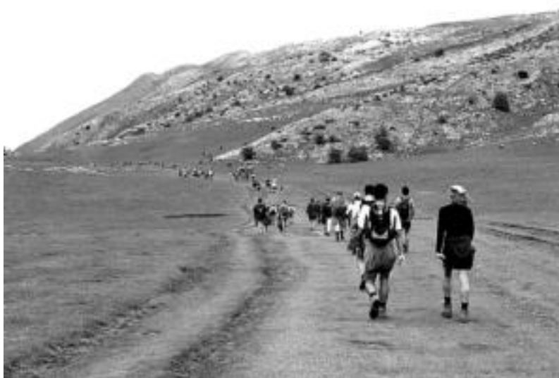
2000. urteko XIV Orduko Ibilaldiko parte-hartzaileak, Aralarko belazeetatik igarotzean. TOLOSALDEKO HITZA

Ibilaldirako sei egun falta direnean, antolatzaileek buru-belarri jarraitzen dute lanean; azken ukituak izan ezik, dena prest da igandeko mendi festarako