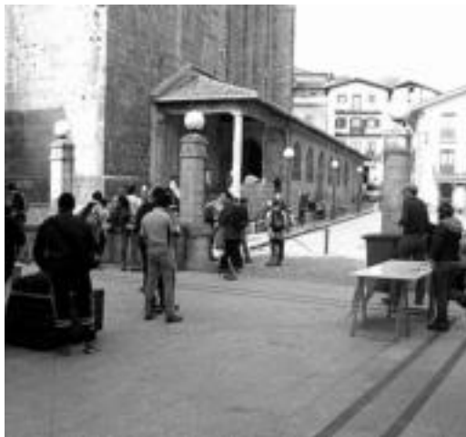
Ibiltariak atseden hartzen Aiako plazan. JOXEMI SAIZAR

Duela zazpi urte mende erdia bete zuen Ernioko gurutzeak. Auzolaneari aritu zirenei omenaldi egin zitzaion, liburu bat atera zen... Behin otu zitzaigun zortzi herriak batzen zituen ibilaldia egin zitekeela agian, eta asteberka batean neurtzera atera ginen. Hamabi orduz ibili