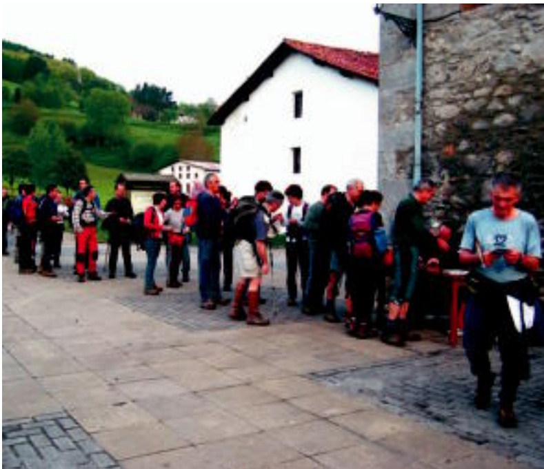
Igandeko ibilaldiko parte-hartzaileak Larraulgo kontrolean seilatzen. JOXEMI SAIZAR

EGURALDIA ▶ Ateri iraun zuen eguraldiak ibilaldian zehar, baina lokatz handia izan zuten ibilbide osoan ▶ 5