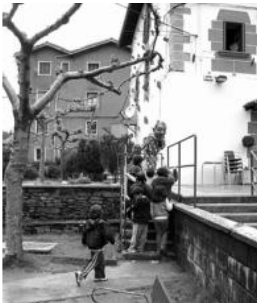
Buruhandiak, atzo, Kultur Astearen hasieran. D. GIBELALDE

Herriko talde ugari antolatuta, larunbata bitarte ekitaldi ugari izango dira