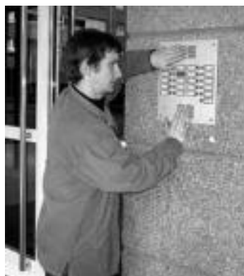
Atariko atea ezin entzun. I. ETXEBESTE

Erakusketa jarri du Gaunditzen elkarteak pertsona gorrek dituzten komunikazio eta lan-mugen inguruan; Kultur Etxean dago zabalik larunbat arratsaldea bitarte