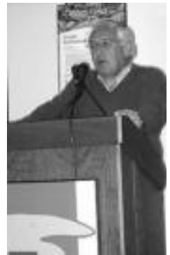
lazko aipamena, Andu Lertxundiri. U. URREAGA