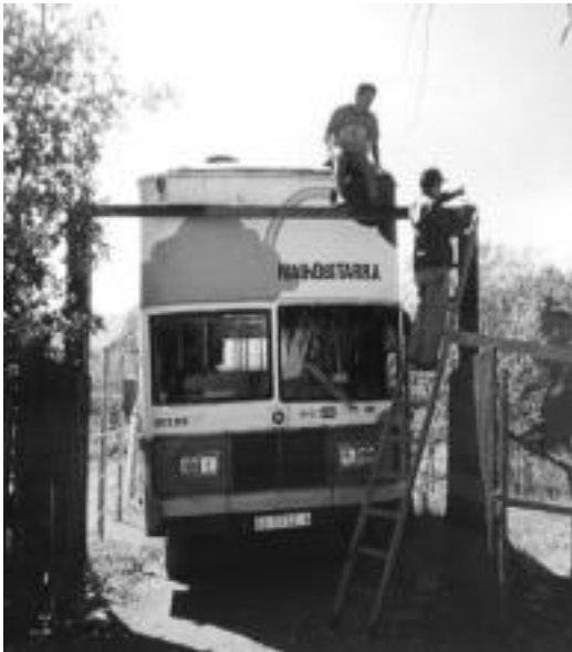
Autobusez mundu osoan miloi bat kilometro egin dute. HITZA

Josu Iztuetaren 'Miloi bat kilometro lur azaletik' izango da ikusgai ostiralean