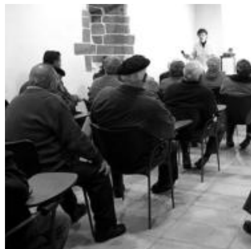
Interes handia sortu zuen gaiak bertaratu zirengan. O.ESKIXABEL