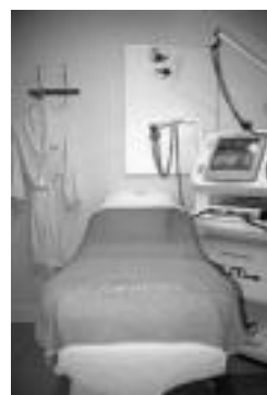
Elitium gela. LEIRE MONTES