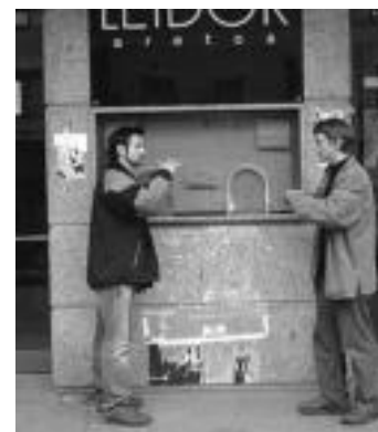
Filmak azpittitulatuta izan ezean... I. ETXEBESTE

askotan ez daude, gainera, zeinu hizkuntza menperatzen duten itzultzaileak: «Turismo bulego, udalsetxe, foru aldundi, INEM edo antzeko zerbitzuetara joatean gaizki pasatzen dugu ez digutelako ondo ulertzen. Itzultzaile zerbitzua eskaini beharko lukete leku horietan», adierazi dute Gaunditzen elkarteko kideek.