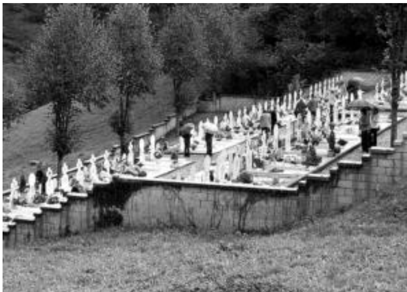
Lurrean lurperatzeko lurrik ez dagoenez, horma-hilobietan sartzen dituzte gorpuak. O.ESKIXABEL

Horma-hilobietan sartzea doakoa da lurrean lurperatzeko lurrik ez dagoelako; hamar urteko kontzesioa dute hauek