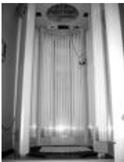
Solarium-a. LEIRE MONTES

Hainbat gelatan dago banaturik Maite Estetikako Zentru Integrala. Gela bakoitza tratamendu zehatz baterako dago egokiturik. Tresna guztiak beharrezkoak diren segurtasun neurriak pasatu dituztela eta legeak ezartzen dituen arauak betetzen dituztela azpimarratu dute zentrukoek.