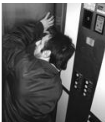
Igogailuan harrapatuta, nola irten? I. ETXEBESTE