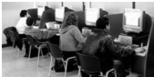
KZgunean, zenbait ibartar nabigatzen. TOLOSALDEKO HITZA

Hilaren 31ean 'Euskal Herria ezagutu' izeneko mintegia eskainiko dute bertan