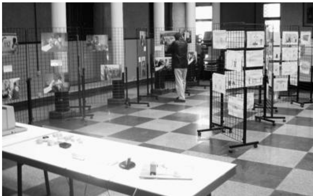
Erakusketa jarri du Gaunditzen elkarteak Kultur Etxean. Argazkiak, mezuak, marrazkiak, aparatuak... bildu dituzte bertan. IRATXE ETXEBESTE

Telefonoak jotzen duenean, beste gelan dauden haurrek negar egiten dutenean, atariko atea jotzen dutenean... Entzuleek entzuten duten soinu bakoitzeko argi bat ikusten dute gorrek. Edo ikusi beharko lukete. Izan ere, asko eta asko dira oraindik gorrentzat egokituta ez dauden lekuak. Horietako