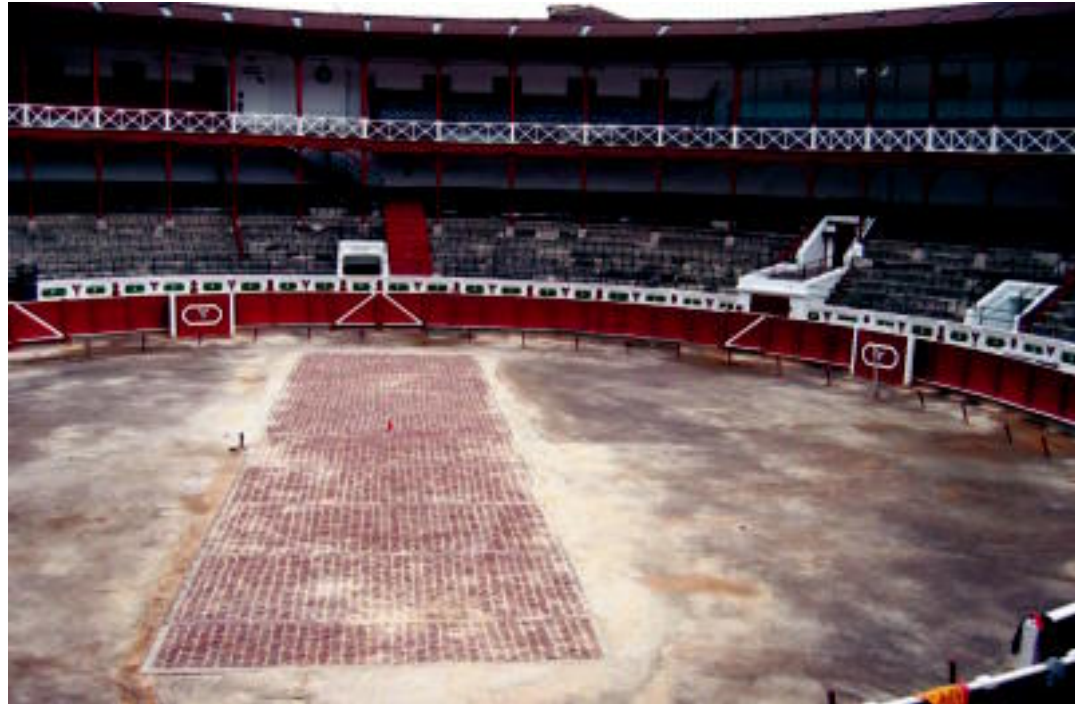
Idi probetarako galtzada-harria eta korrikalari apustuatarako uztia agerian dago egun hauetan zezen-plazan. JOXEMI SAIZAR

TOLOSA ▶ Hondar berria jartzeko, zegoen guztia kendu dute zezen-plazan; azpian idi-probetarako galtzada-harria eta apustuatarako ibilbidea ageri da