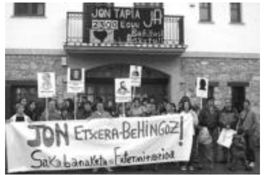
Zizurkil goien bildu ziren zizurkildarrak. G. AZKUE