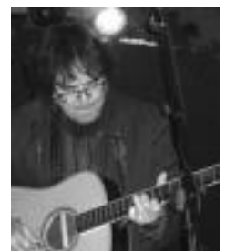
Ordorika, Bonberenean. HITZA