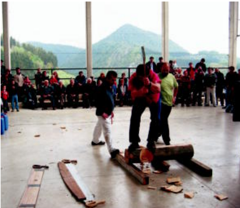
Aizkora apustua egin zuten atzo eguerdian herritarren artean. DANI GIBELALDE

AUZOAK ▶ Intxaurpek herri kiroletan eta sokatiran irabazi zuen, Elbarrenek pilotan; amaitu dira jaiak ▶ 6