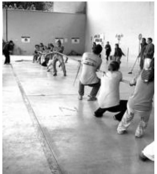
Sokatirak erabaki zuten auzotarren arteko lehia. D. GIBELALDE