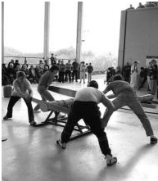
Trontzan, Elbarrene eta Intxaurpeko bina lagun. D. GIBELALDE

Hiru puntu izan zituzten jokoan bi auzoetako lagunek. Pilotan, binaka, Elbarrenekoek irabazi zuten (22-19). Bigarren puntua Intxaurpekoek irabazi zuten herri kiroletan: trontzan, lasterka, txinga proban, aizkoran, eta lokotsak biltzen. Sokatirak erabaki zuten; bi tiraldi eginda berdinketa zegoen, eta hirugarrengoan Intxaurpe nagusitu zen. Hurrengo urtean beharko du errebantxak.