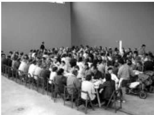
Giro onean joan zen urteroko txekor-jatea.

Eskuratutako dirua herriko gimnasioa egokitzeko erabiliko dute.