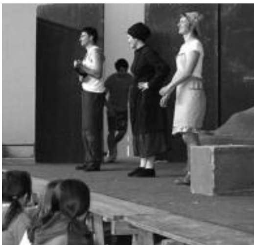
540 lagun bildu ziren Kutsidazu bidea , Ixabel antzezlanean. HITZA