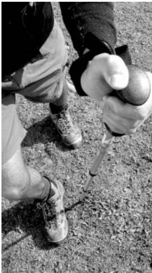
Bastoiak mesede egiten dute ondo erabiliz gero. HITZA