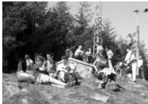
lazko Andatza Eguna. TOLOSALDEKO HITZA

12:00etan hasiko dira herri kirolak eta jokoak haur zein helduentzat. Eta ondoren, 14:00ak inguruan, bazkariak emango diote hasiera. Jatekoak zein edatekoak norberak eraman beharko ditu, eta antolatzaileek kafeak eta kopak banatuko dituzte bazkatzen gera-