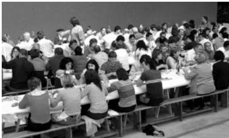
Atari-Soro pilotalekuan izango dira txekor-jatea eta Kutsidazu bidea, Ixabel antzezlanak. MAIDER JAUREGI