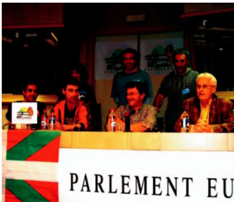
Tolosaldeko ordezkariak Koldo Gorostiaga Europako legebiltzarkidearekin. HITZA

UDALAK ▶ Tolosaldeko ordezkariak baziren tartean; Aduna eta Gazteluko udalek sostengua eman dute ▶ 5