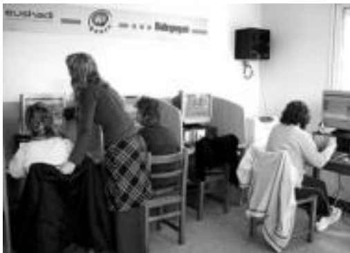
Sei ordenagailu aurkitzen dira Bidegoiango KZgunean. O.ESKIXABEL

Bidegoiango KZgunea pasa den astean ireki zuten; herenegun hasi zituzten ikastaroak