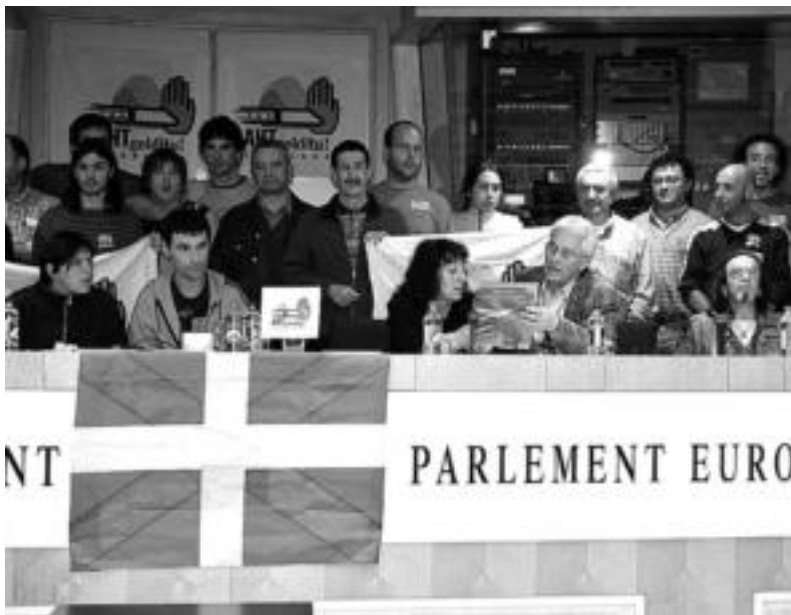
AHT Gelditu! Elkarlaneko kideak Europako Parlamentuan. HITZA

Euskal Herri osoko ordezkarietan Tolosaldeko kideak ere izan ziren trenaren kontrako aldarrian