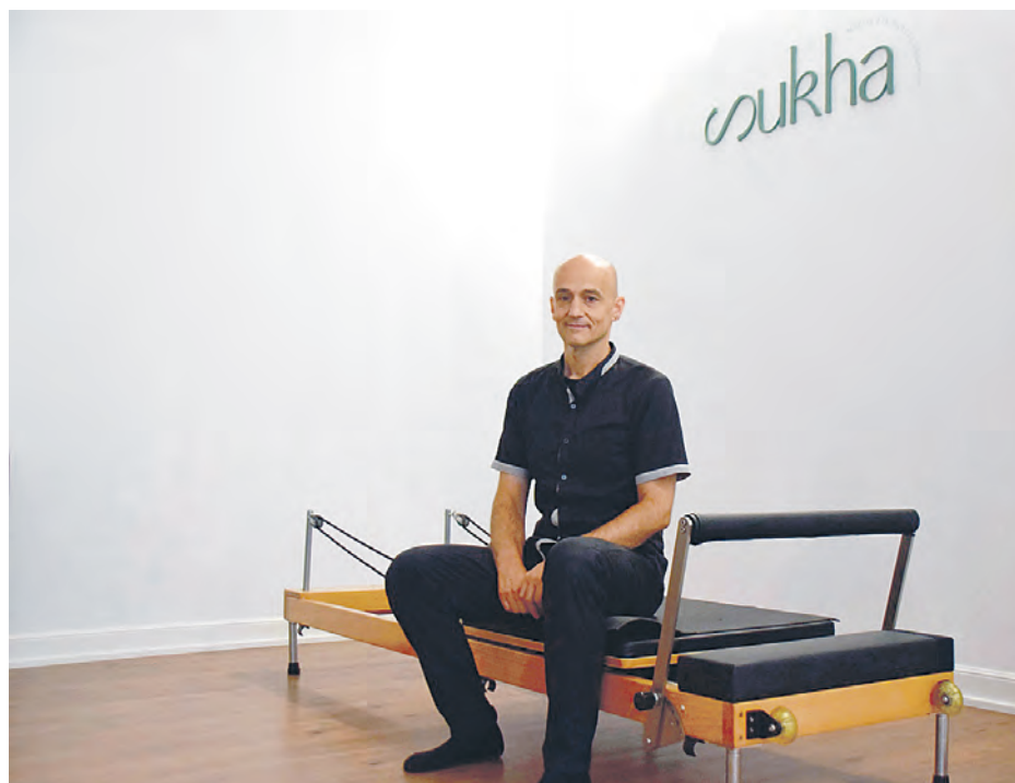
I. S. A.

Sukha zentroak terapia gela bat eta jar-