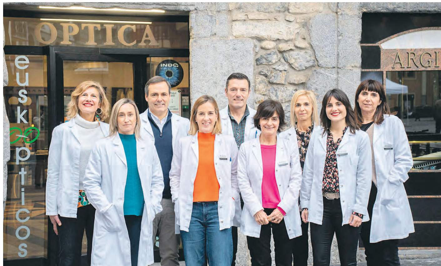
Argizti Optikako lantaldea Tolosako Trianguloan duten zentroaren aurrean. ENDIKA APALATEGI

Argizti Optikak gehienbat betaurrekoetan oinarritzen den zerbitzua eskaintzen duela adierazi du Zamarripak. Graduatutako betaurrekoak, betaurreko progresiboak, gertuko betaurrekoak eta eguzkitako betaurrekoak izaten dira gehien saltzen direnak. «Orain, esaterako, betaurreko progresiboak pertsonalizatzeko aukera eskaintzen diegu bezeroei errealitate birtuala erabiliz. Horrela, norberak duen ikusteko dinamia ezagutzen dugu eta horren ara-