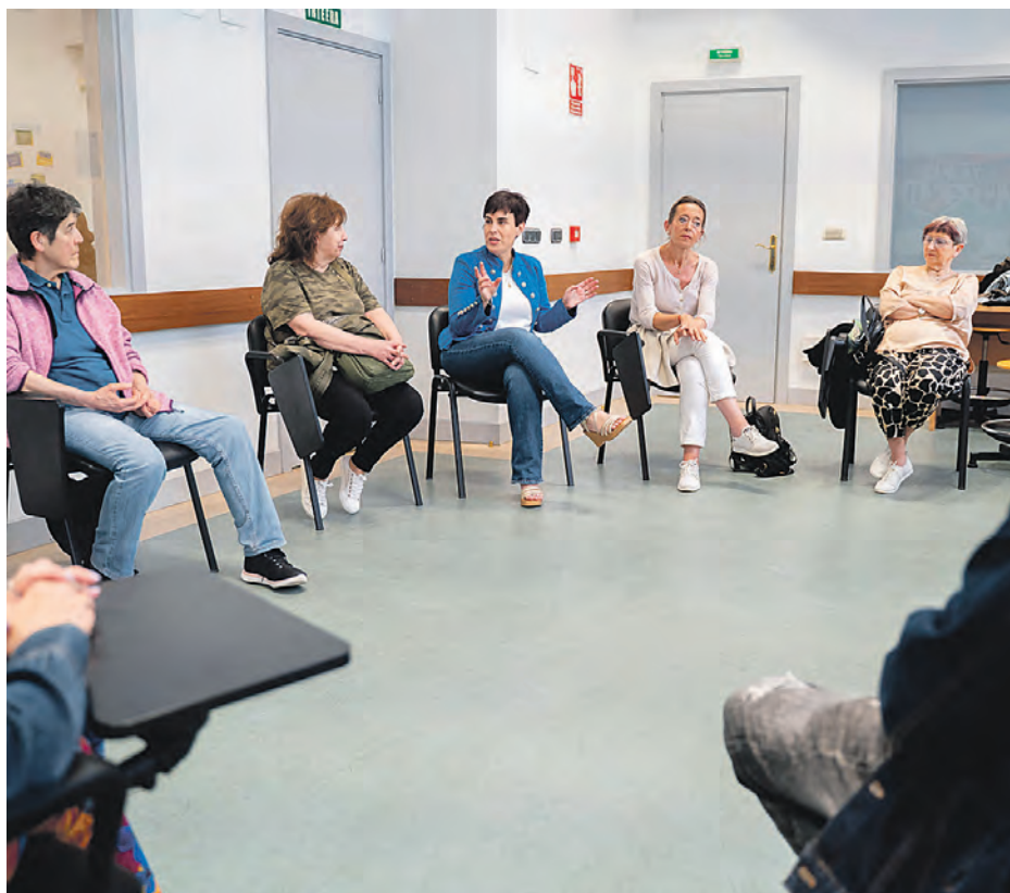
Hainbat zerbitzu eskaintzen dituzte Agifes elkarteak. AGIFES

bakoitzean dugun erantzukizuna gure gain hartuz, egoera bakoitzak dakarkigun esperientziatik ikasi eta barruko bake sententzia indartu ahal izango dugu.