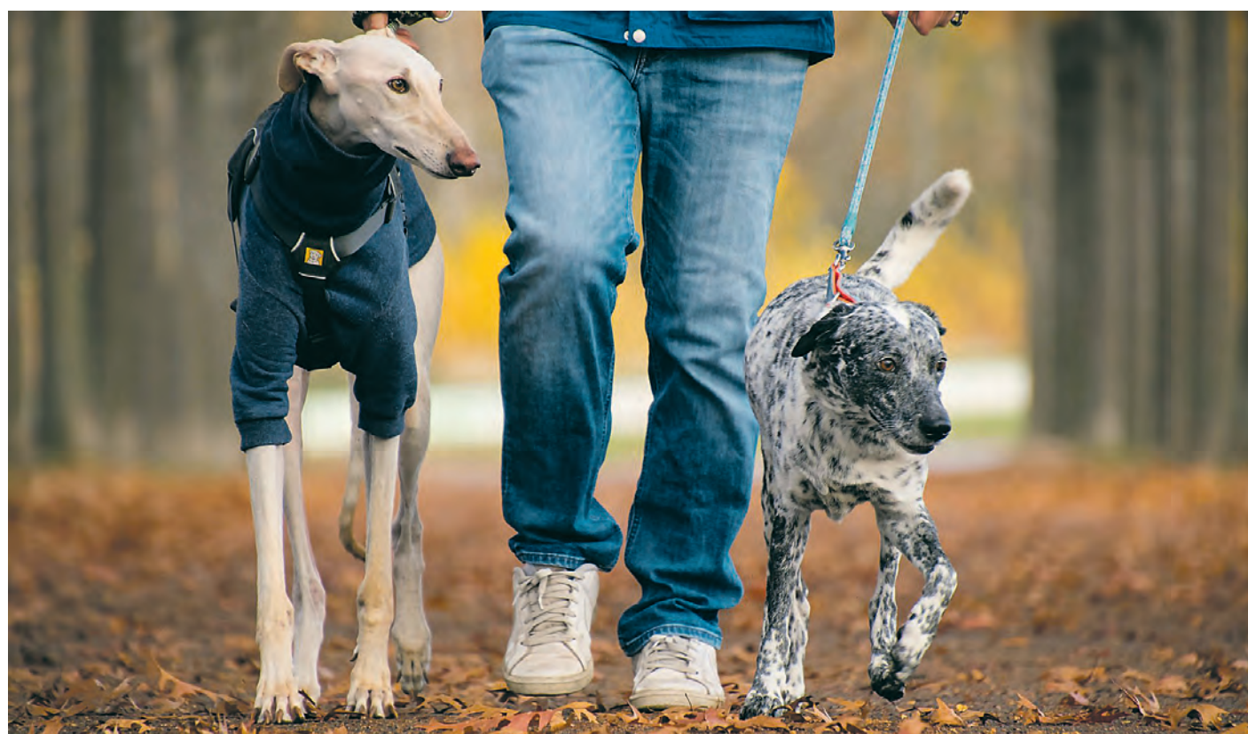
Bakoitzak dituen ezaugarriak, denbora eta baldintzak hartu behar dira kontuan maskota bat aukeratzekoan. ATARIA

Etxeko animaliek beraz, eskubide gehiago dituzte orain, eta gizakiaren mehatxu eta erasoetatik babesteko aukera ematen die legeak. Hori baina, bigarren pausoa li-